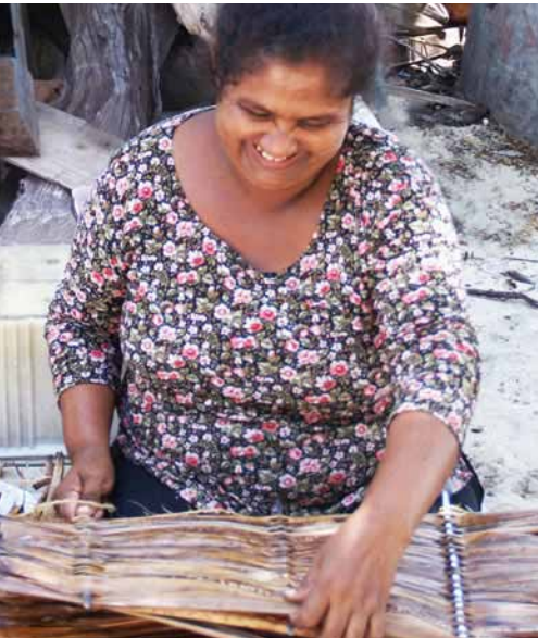
Đánh đưng lợp nhà, Maldives