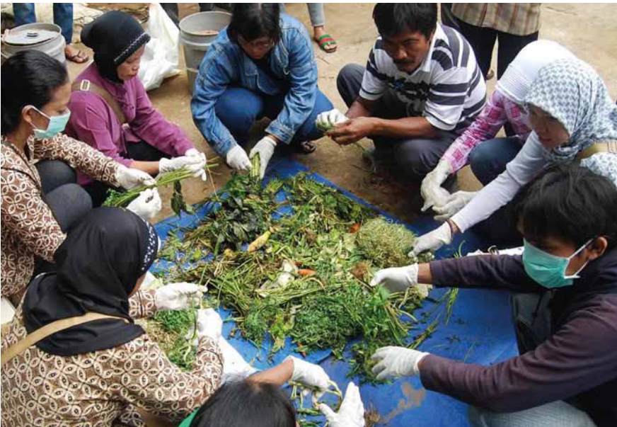
Lồng ghép yếu tố về giới trong tập huấn về phương pháp tái chế rác hữu cơ, Pemalang, Trung Java, Indonesia

Những mục tiêu này được thiết kế để tăng cường sử dụng bền vững tài nguyên ven biển và nâng cao sức chống chịu đối với các mối đe dọa ngày càng lớn từ biến đổi khí hậu và thiên tai.