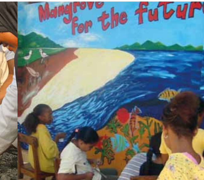
Trẻ em đang vẽ tranh trên tường tại trường học @MFF Seychelles