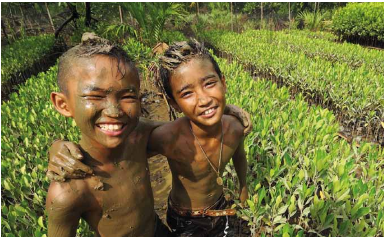
Ranong, Thailand

MFF trực tiếp đầu tư vào hệ sinh thái ven biển thông qua các dự án hiện trường phù hợp với các Chương trình Làm việc. Các dự án này đóng vai trò hiệu quả trong thử nghiệm các phương pháp mới và đột phá, thông qua quá trình giám sát, học hỏi và đánh giá, và sau đó chia sẻ trên diễn đàn kiến thức của MFF.