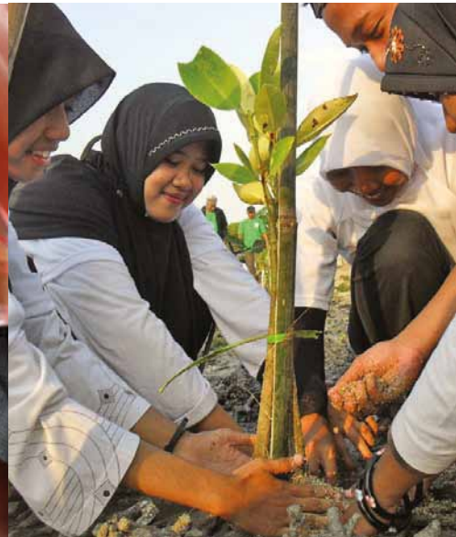
Trồng đước, Đông Java, Indonesia