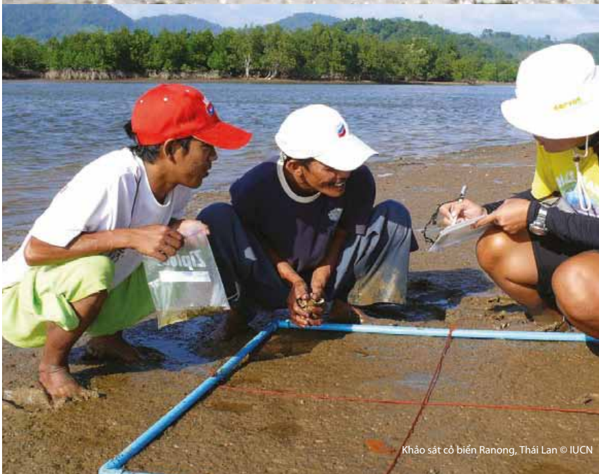
Khảo sát cỏ biển Ranong, Thái Lan