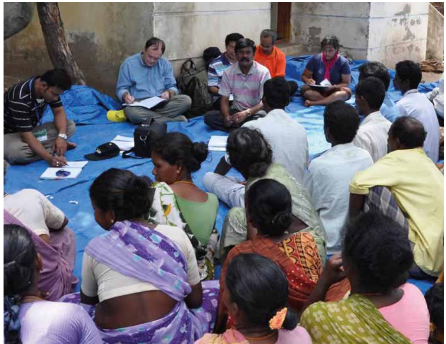
Đánh giá nhanh có sự tham gia, Tamil Nadu, Ấn Độ

Việc đánh giá hiệu quả quản lý các khu bảo tồn biển ở Thái Lan có khả năng tác động lớn tới chính sách quốc gia đối với quản lý các khu bảo tồn. Dự án này đang đánh giá quá trình và những nguyên tắc của quản lý cấp hệ thống, làm cơ sở để đề cử khu liên hợp biển Andaman là di sản thế giới UNESCO.