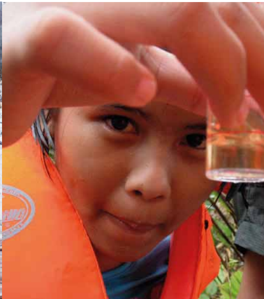
Giám sát chất lượng nước, tỉnh Ranong, Thái Lan