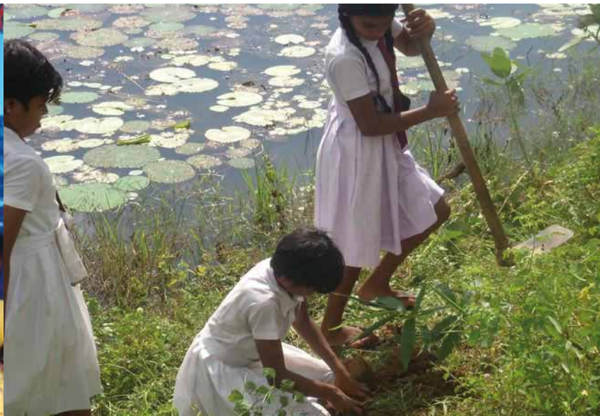
Trồng tre phục hồi bờ sông, Sri Lanka