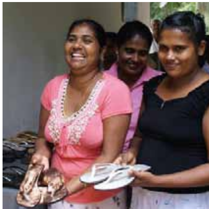
Sản xuất giầy, sinh kế thay thế cho người dân khai thác cát ven sông Sri Lanka

Nâng cao năng lực quốc gia về quản lý hệ sinh thái ven biển là một ưu tiên lớn đối với MFF. Phương pháp tiếp cận của MFF hiểu rằng cả kiến thức khoa học và kiến thức cộng đồng (tri thức bản địa) cần được xác định và tổng hợp nếu muốn quản lý hiệu quả các nguồn tài nguyên ven biển. Để đáp ứng nhu cầu này, MFF giúp đỡ các quốc gia và dự án áp dụng những kinh nghiệm tốt nhất trong Quản lý Tổng hợp Vùng Ven biển thông qua tập huấn tương tác sử dụng nhiều bộ công cụ tập huấn.