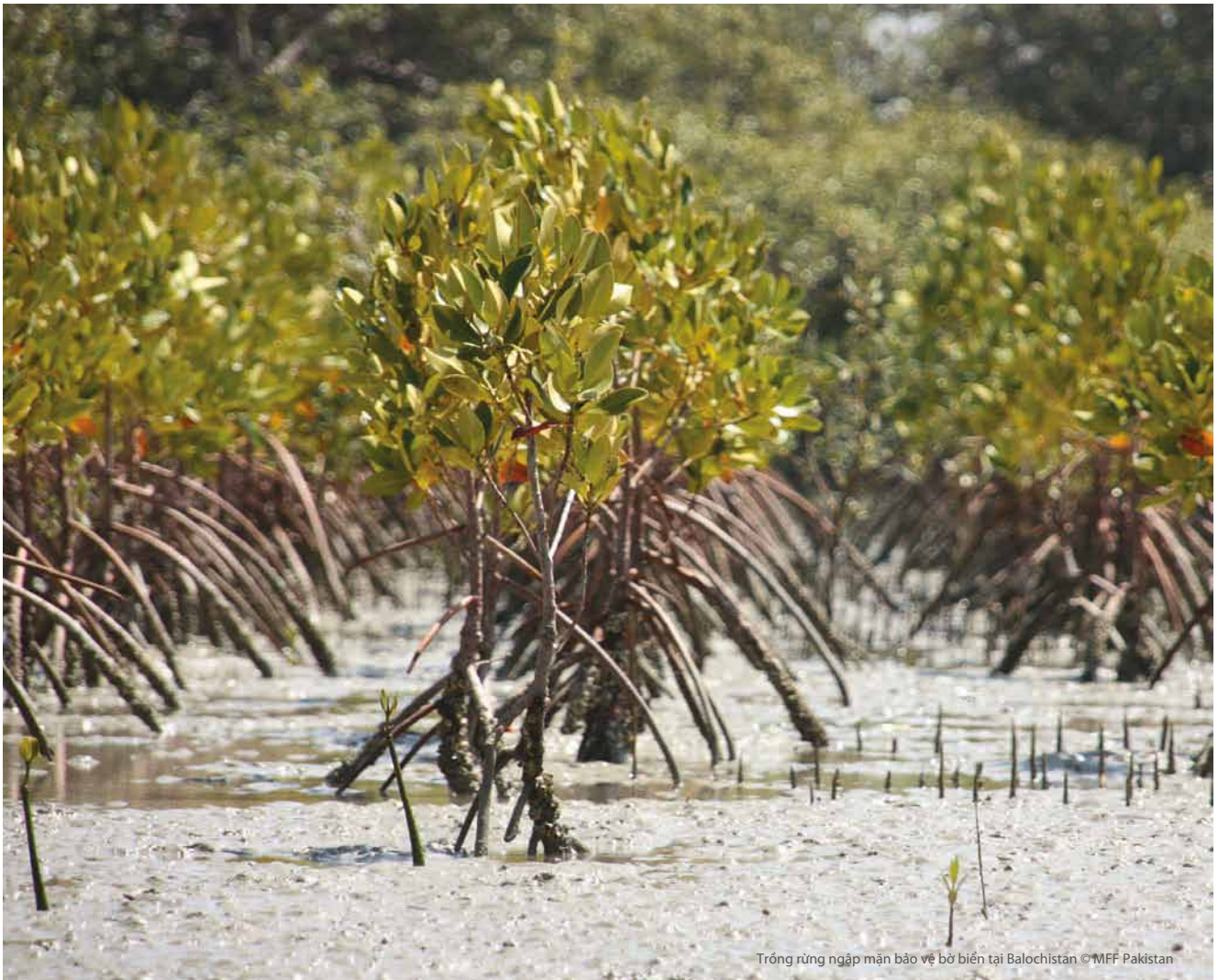
Trồng rừng ngập mặn bảo vệ bờ biển tại Balochistan