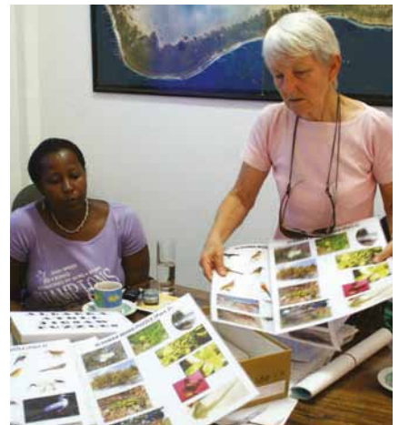
Sách Giáo khoa và các bộ sách hướng dẫn về các khu Di sản Thiên nhiên Thế giới Aldabra Atoll, Seychelles

Phối hợp với nhau, quản lý thông tin và truyền thông cấu thành diễn đàn thông tin MFF, một trung tâm lưu trữ và phổ biến thông tin về nguồn nhân lực, kênh truyền thông, quá trình học tập, giám sát, và cơ chế phản hồi từ người sử dụng. Diễn đàn thông tin này sẽ tăng cường luồng thông tin trao đổi giữa các bên liên quan và giữa các cấp từ khu vực, đến quốc gia và dự án. Luồng thông tin này có vai trò vô cùng quan trọng trong việc giúp MFF đạt được mục tiêu của Sáng kiến, cũng như đảm bảo các kết quả, bài học và phương pháp tốt nhất được chia sẻ rộng rãi.